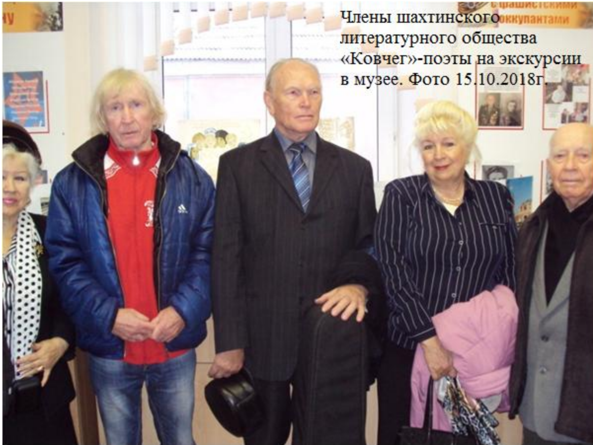
Члены шахтинского литературного общества «Ковчег»-поэты на экскурсии в музее. Фото 15.10.2018г.