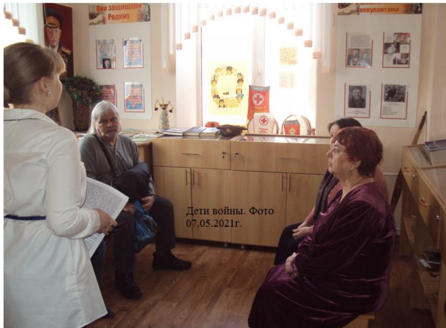
Дети войны. Фото 07.05.2021г.